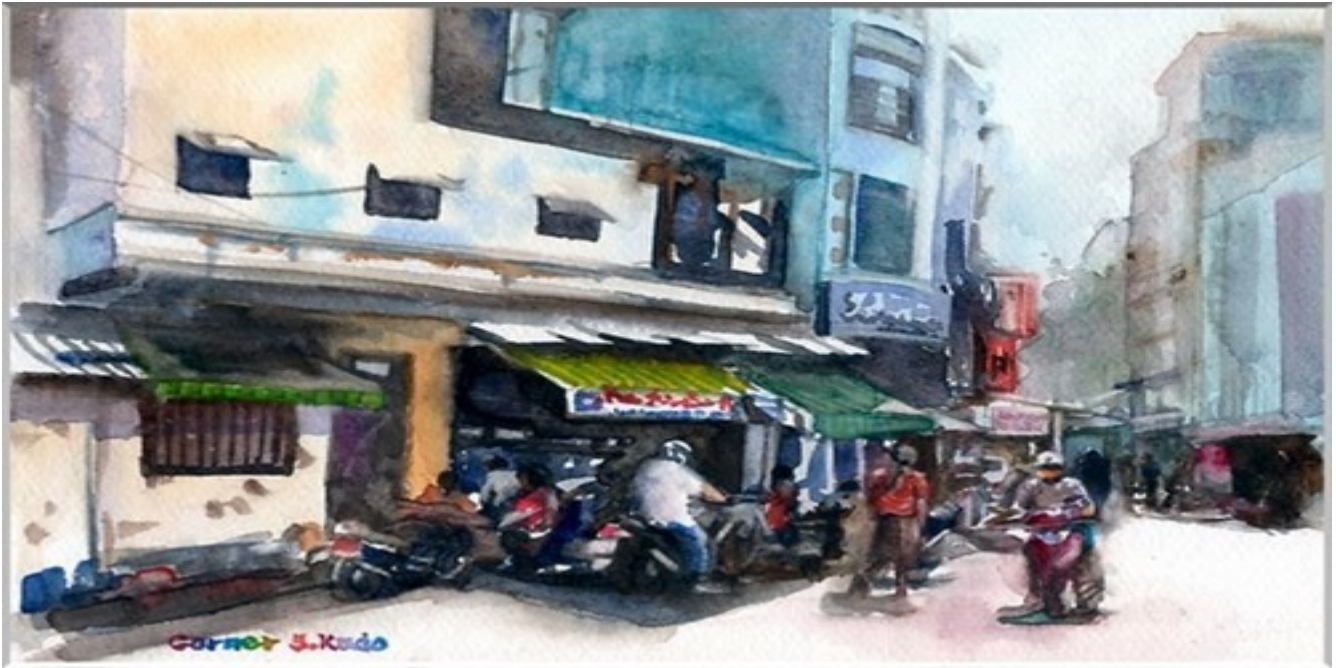
Quán cà phê góc phố hút người lao động ghé xem tin tức buổi sáng. Thân thương quá những điều quen thuộc hằng ngày mà mình vô tình lướt qua....