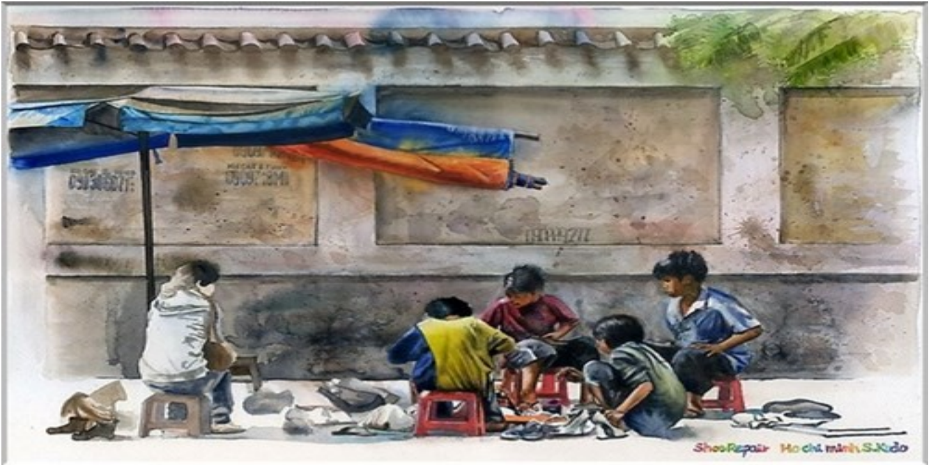
Lũ nhóc đánh giày và bức tường loang lổ những mảng rêu phong khiến cho người ta có cảm giác thật chạnh lòng.