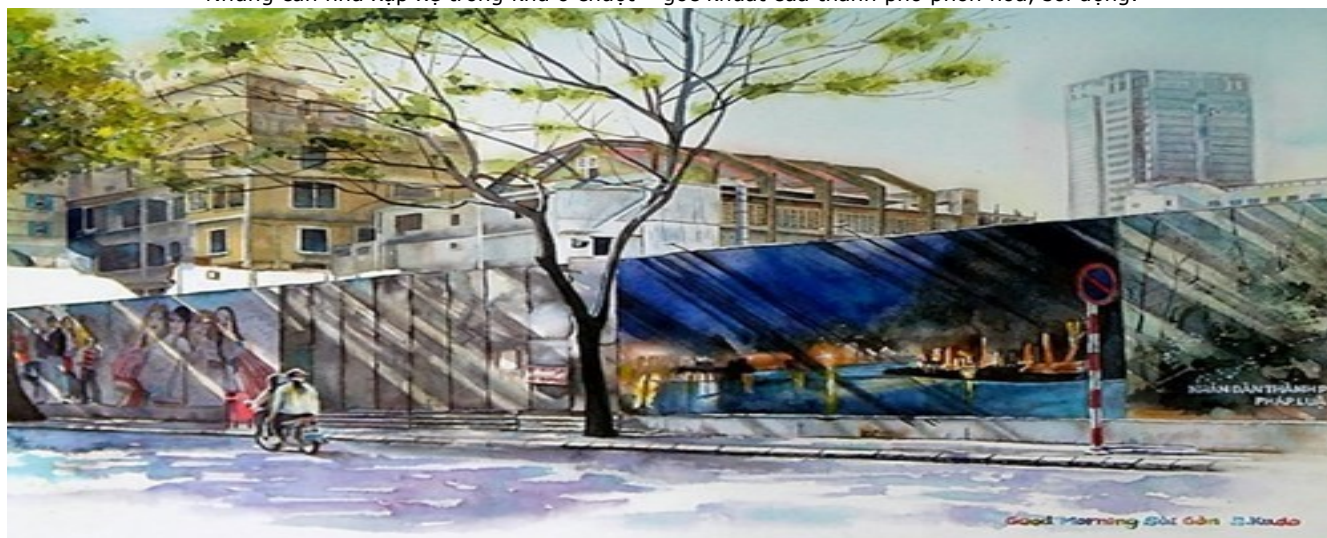
Con đường quen thuộc ở trung tâm thành phố với bức tường che khu công trình đang thi công.