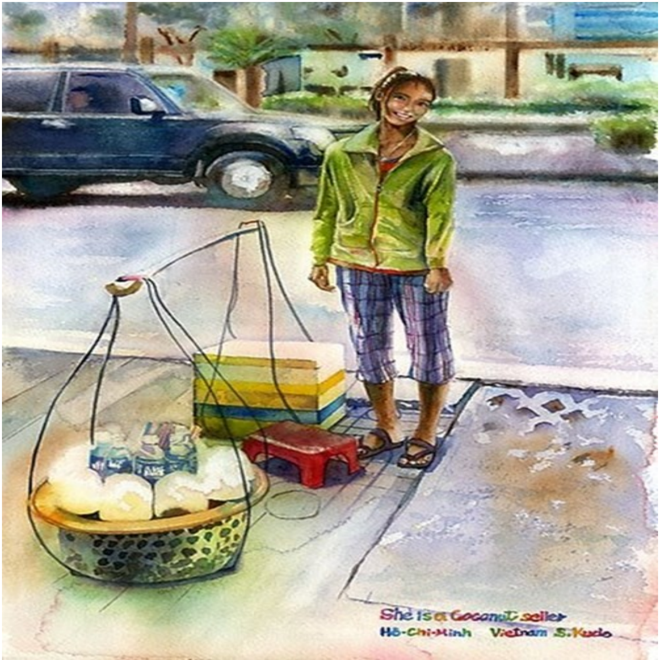
Nụ cười hồn nhiên của chị bán hàng rong trên phố.