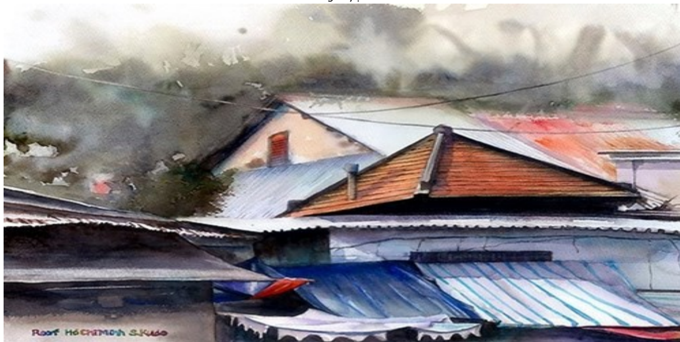
Những căn nhà xập xệ trong khu ổ chuột - góc khuất của thành phố phồn hoa, sôi động.

Một góc phố Sài Gòn mát rượi dưới tán cây xanh, một ngôi nhà cổ nằm lọt thỏm giữa những cửa hiệu hạng sang... Đối lập nhưng tuyệt vời!