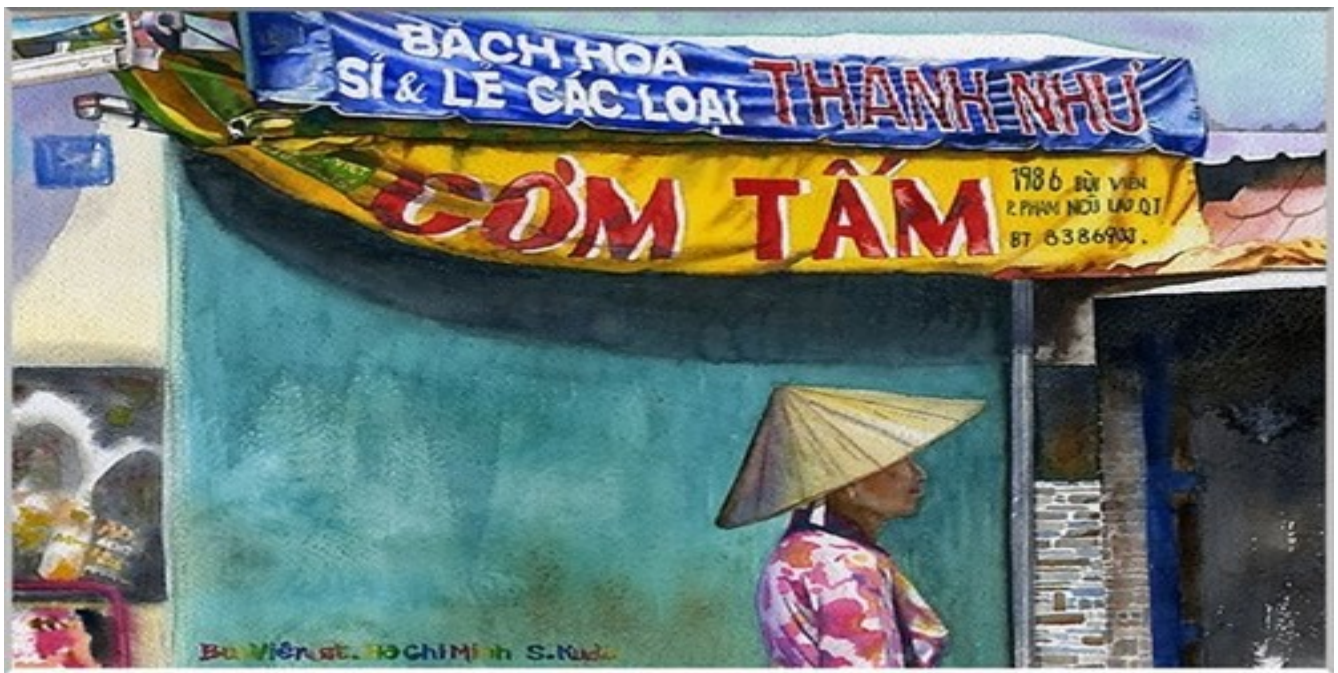
Quán cơm tấm bình dân trên đường Bùi Viện. Khi đã vào tranh của họa sĩ Satoshi Kudo thì những thứ bình thường đều trở thành "không tầm thường".