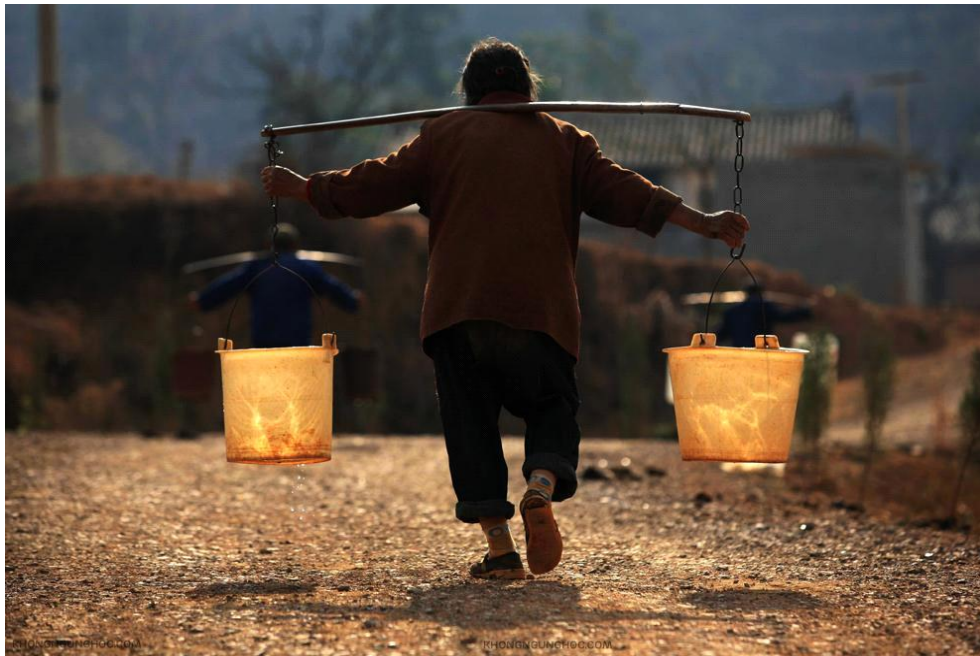
Mỗi lần có tân binh quân dịch tập luyện ở bãi tập thì mẹ tôi gánh nước cho anh em uống.

Dì thương chúng tôi lắm, cháu nào dì cũng thương, nhưng có lẽ trong những người cháu của dì, tôi gần gũi dì nhiều nhất. Mỗi lần muốn làm việc từ thiện, tôi không có tiền thì tôi xin tiền mẹ tôi và dì tôi. Dì tôi hiền như mẹ tôi, ít nói, dễ thương và phúc hậu. Mẹ tôi hiền lắm, hay giúp người. Mẹ tôi và dì tôi làm việc từ thiện thường xuyên. Ba tôi dạy võ miễn phí cho trai trẻ trong làng. Mẹ tôi hay thương người, nhà tôi có cái giếng đào quanh năm nước trong vắt, mỗi lần có tân binh quân dịch tập luyện ở bãi tập, mẹ tôi gánh nước cho anh em uống. Sau này khi tôi lớn lên hình ảnh làm việc thiện tuyệt vời của mẹ tôi in vào đầu tôi, một người phụ nữ hiền lành, ốm yếu, nụ cười thật tươi gánh nước cho tân binh quân dịch uống. Quý vị khó tưởng tượng được nhưng đây là sự thật đã xảy ra thập niên 50 quý vị ạ. Những tân binh này còn sống sót cũng lớn tuổi hơn chị em chúng tôi nhiều.