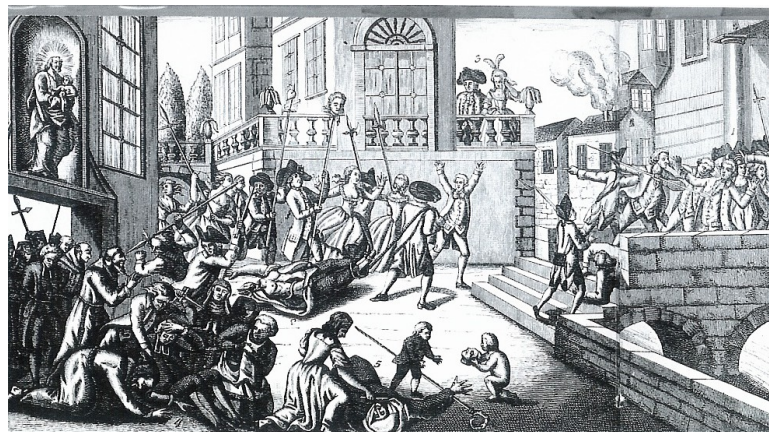
The Massacres of September 2-6, 1792