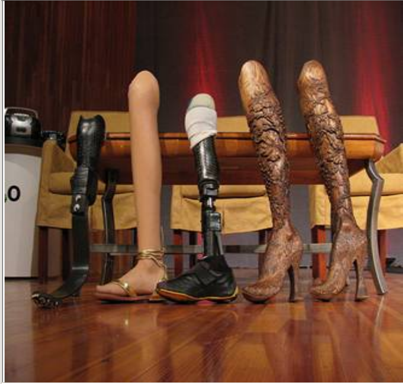
Khi Aimee sải bước trên sàn catwalk tại tuần lễ thời trang London năm 1998 tại show diễn của Alexander McQueen với đôi giày gỗ chạm trổ tinh vi.

Không chỉ dừng lại ở đó, cô còn là một diễn viên xuất sắc và đã từng được khen ngợi rất nhiều khi đảm nhiệm vai nữ chính trong bộ phim Cremaster 3 của đạo diễn Matthew Barney. Đầu năm 2011, Aimee được mời làm đại sứ toàn cầu của nhãn L'Oréal Paris cùng với những mỹ nhân của kinh đô điện ảnh thế giới như: Jennifer Lopez, Beyoncé, Eva Longoria và Cheryl Cole.