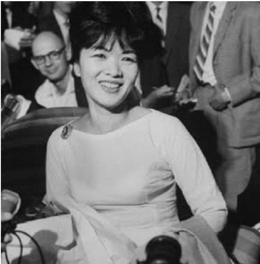
Đệ Nhất Phu Nhân Trần Lệ Xuân (1924-2011) - Ảnh tư liệu

(NCTG) “Cái đám đàn ông học ở đâu cái thói “nói xấu đàn bà là thú vui thần thánh” cóc biết gì hùa nhau viết về bà Nhu cứ như hàng xóm. Không ai nhớ một điều vô cùng đẹp từ cô tiểu thư xuân thì 15 tuổi trở thành phu nhân quý phái: Bà Nhu mặc hàng nội hóa nhiều hơn là hàng lụa nhập cảng từ Ý, Thái, Ấn Độ, Ba Tư”.