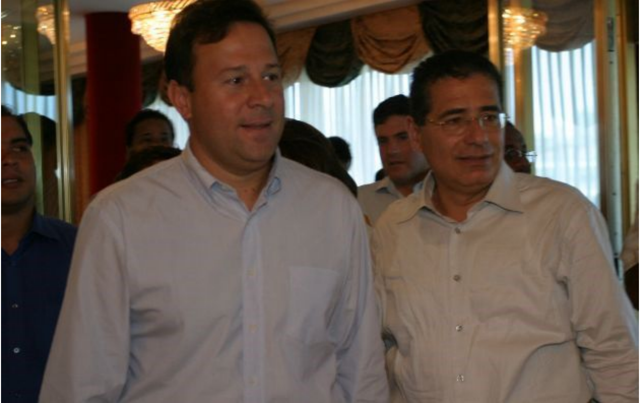
Tổng thống Panama Juan Carlos Varela lên nhận nhiệm sở vào năm 2014, ông Fonseca giữ chức cố vấn.

Khi Tổng thống Panama Juan Carlos Varela lên nhận nhiệm sở vào năm 2014, ông Fonseca giữ chức cố vấn.