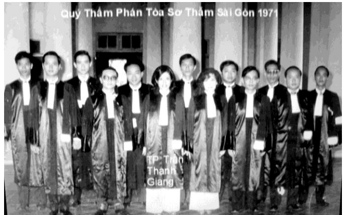
Các Thẩm Phán của Tòa Sơ Thẩm Sài Gòn

Dự Thẩm chỉ thụ lý các vụ kiện do Biện Lý yêu cầu bằng Khởi Lệnh Trạng hay do đơn khiếu tố của người bị thiệt hại đứng dân sự nguyên cáo. Những đơn khiếu tố của người bị thiệt hại phải chuyển cho Biện Lý để lập Khởi Lệnh Trạng .