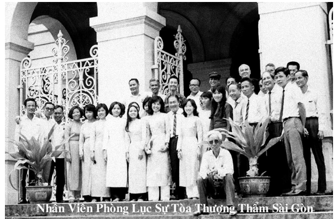
Các Nhân Viên của Phòng Lục Sự của Tòa Sơ Thẩm Sài Gòn

can. Đó là nguyên tắc, Dự Thảm chỉ thụ lý những dữ kiện của sự phạm pháp chứ không thụ lý về cá nhân người phạm pháp. Chính vì thế, Dự Thảm không bị bắt buộc chỉ mở thẩm cứu chống những bị cáo mà Biện Lý đã nêu rõ danh tánh. Nếu Dự Thảm nhận thấy rằng ngoài các bị cáo trên, còn một số người nữa cũng liên can, thì Dự Thảm có quyền mở cuộc thẩm cứu truy tố luôn những người này và nếu cần ra lệnh tổng giam họ mà không cần phải đợi Biện Lý ra Luận Trạng Khởi Tố thêm rồi mới mở cuộc thẩm cứu tiếp. Quyền hành của