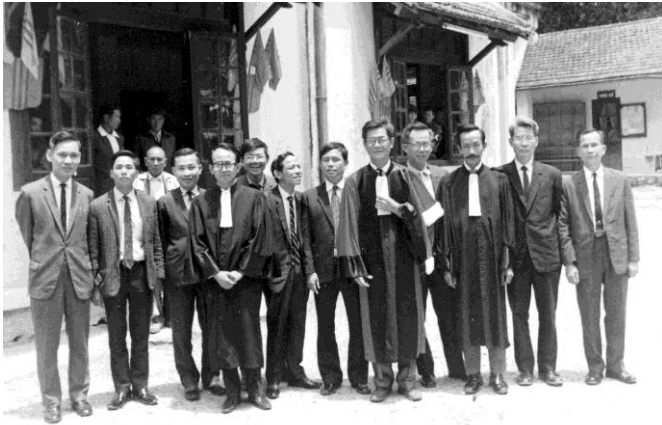
Các thẩm Phán , Luật sư và nhân viên của Tòa Án Sơ Thẩm Đà Lạt

Để hành sử nhiệm vụ, Dự Thẩm được quyền điều động các sĩ quan cảnh sát tư pháp hay hình cảnh lại. Trong trường hợp phạm pháp quả tang, nếu Dự Thẩm có mặt nơi xảy ra vụ phạm pháp, Biện Lý cùng các hình cảnh lại đương nhiên chấm dứt nhiệm vụ và kê từ lúc