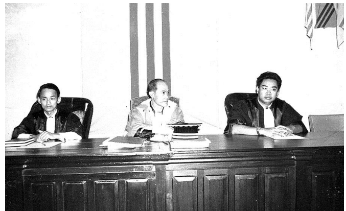
Các Thẩm Phán trong một phiên xử

Đơn Khiếu Tố đệ cho Dự Thẩm sẽ được Dự Thẩm chuyển đến Biện Lý để vị này định liệu truy tố