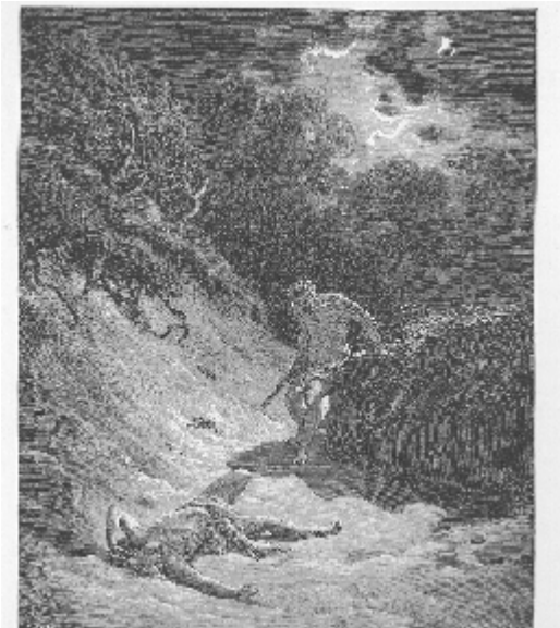
(The Death of Abel. From La Sainte Bible 1866. Engraving. Họa Sĩ Pháp Gustave Doré tả vụ cố sát Abel. Bức tranh in từ bản khắc trong Thánh Thư. 1866)

Phạm nhân Cain bị xua đuổi khỏi khu dân cư đông đúc, bị lưu đầy vào chốn hoang vu tại xứ Nod về phía Đông Eden, nơi đó không có gia đình, luật pháp và Thượng Đế che chở cho y.