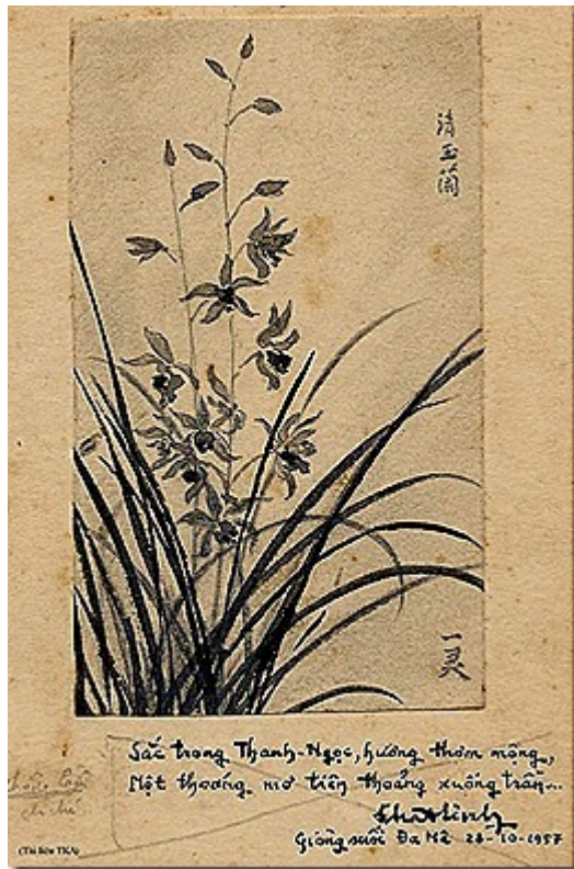
Hoa Phong Lan của Nhật Linh (28/10/1957)

buổi đi chơi xa hoặc đi tìm lan ông thường vẽ phác phong cảnh và hoa phong lan trên một cuốn sổ tay. Thời gian này tôi thấy ông vẽ còn nhiều hơn là ông viết nữa.