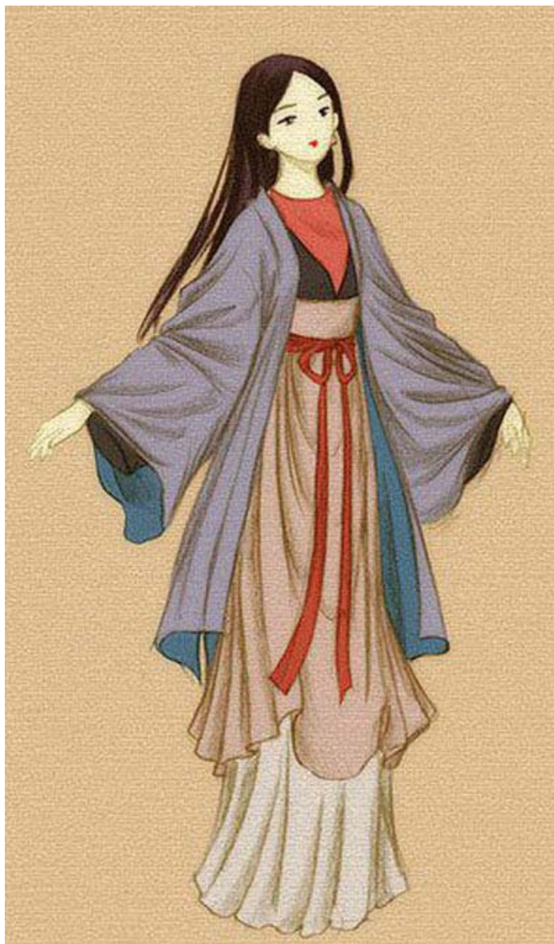
Những bộ trang phục của phụ nữ thời kỳ Hậu Lê rất kín đáo với nhiều lớp áo mang nhiều màu sắc khác nhau. Đặc trưng nhất vẫn là phần ống tay rộng