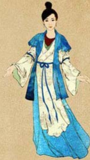
Fig. 3: 11-13th Century Ly Dynasty