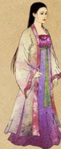
Fig. 6: 16th Century Mac Dynasty