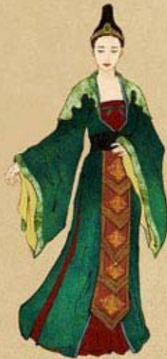
Fig. 4: 13-15th Century Tran Dynasty