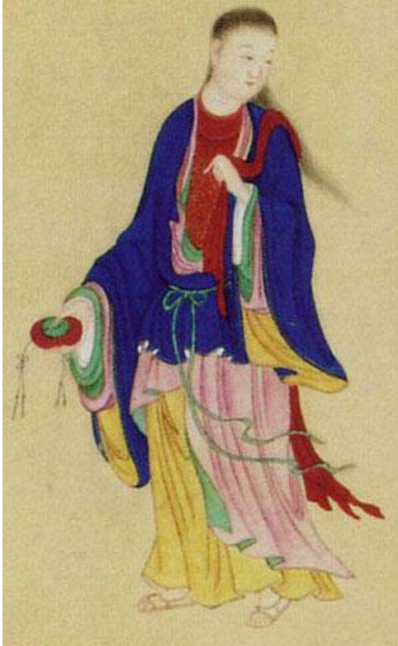
Hoàng Thanh chức công đồ - Thời Trịnh Nguyễn