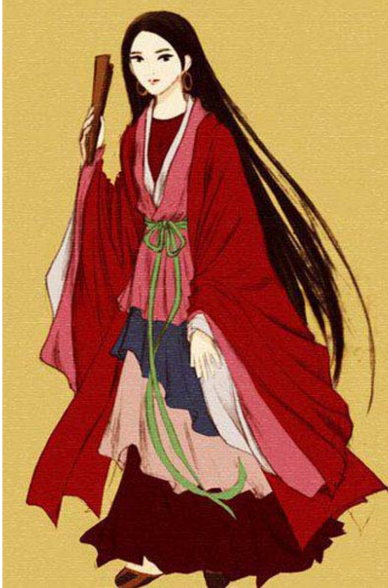
Trang phục cuối đời Trịnh Nguyễn