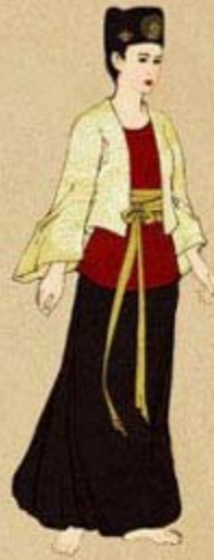
Fig. 2: 11-13th Century Ly Dynasty