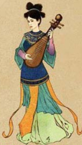
Fig. 5: 15-16th Century Tran - Early Le Dynasties