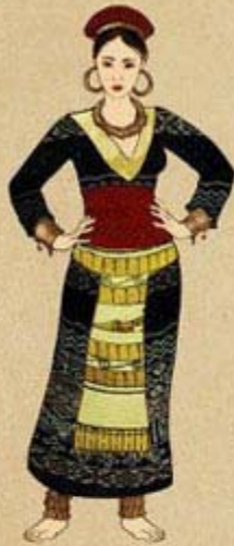
Fig. 1: 2,000 BC-200 AD Dong Son Culture Before Han Chinese Influence