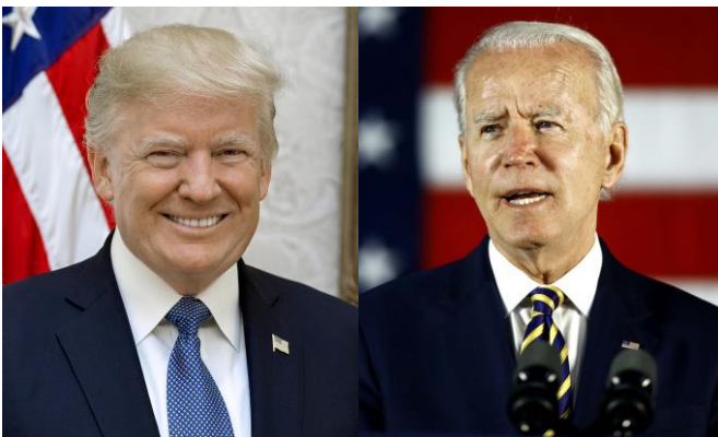
Ông Donald Trump Ông Joe Biden

Ngày thứ ba 3-11-2020 tới đây, nước Mỹ sẽ tổ chức cuộc bầu cử chọn Tổng Thống giữa ông Donald Trump, đương kim tổng thống thuộc đảng Cộng Hòa và cựu Phó Tổng Thống Joe Biden thời TT Obama thuộc đảng Dân Chủ. Đây được xem là một cuộc bầu cử gây nhiều tranh cãi, tạo nhiều chia rẽ nhất giữa hai phe bên vực và chống TT Donald Trump trong quần chúng Mỹ và ngay cả trong cộng đồng VN.