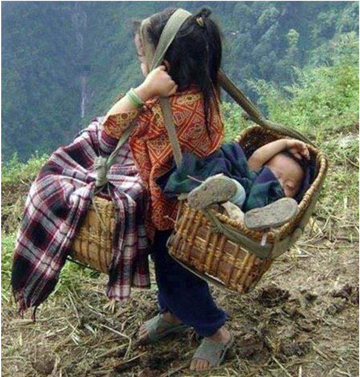
Đứa trẻ nằm ngủ ngon lành trên chiếc nôi của chị.