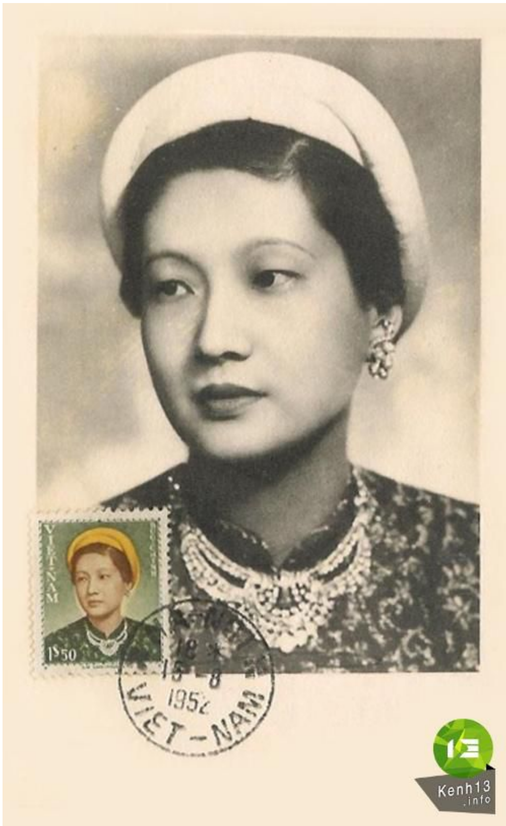
Chân dung Nam Phương Hoàng hậu trên con tem phát hành năm 1952.