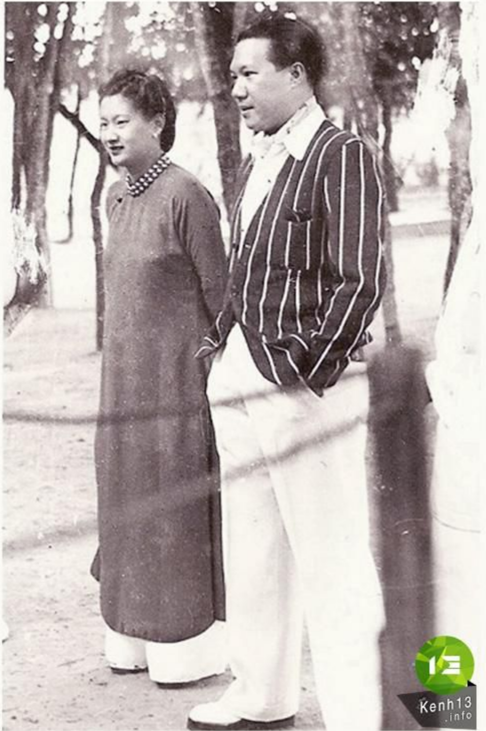
Hoàng hậu Nam Phương và vua Bảo Đại đứng xem cuộc diễn hành ở xứ Chùa Tháp chào mừng Hoàng gia Việt năm 1942.