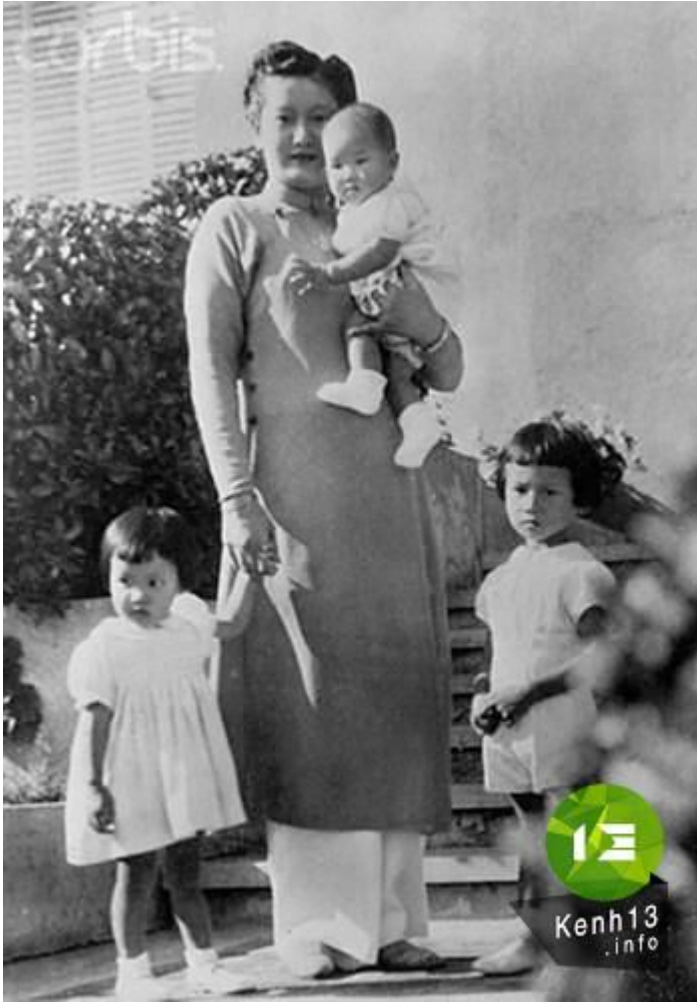
Nam Phương Hoàng hậu và các con.