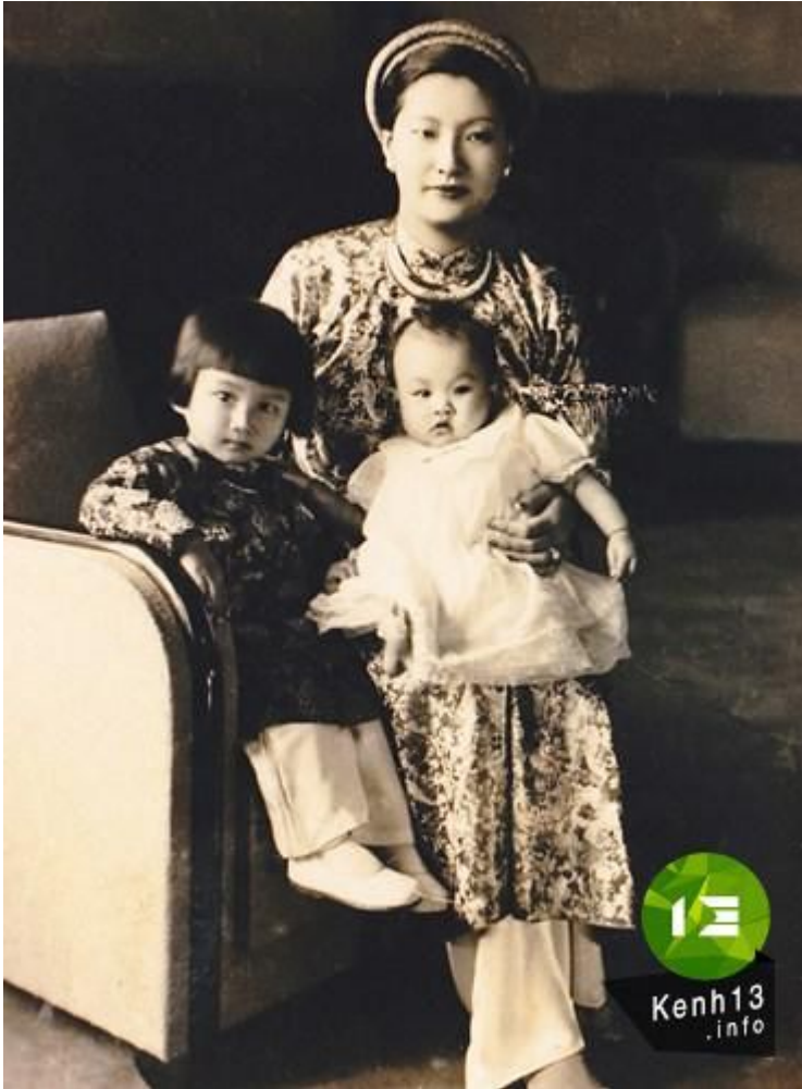
Hoàng hậu Nam Phương với Hoàng tử Bảo Long và Công chúa Phương Mai.