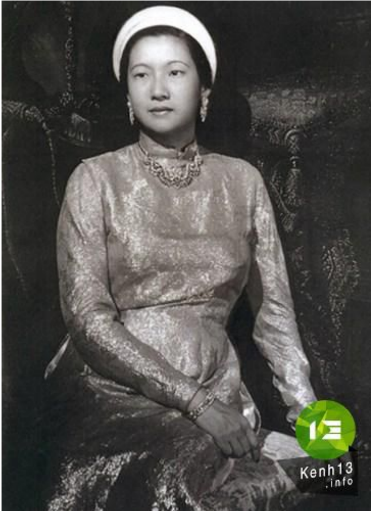
Hoàng hậu Nam Phương trong trang phục truyền thống.