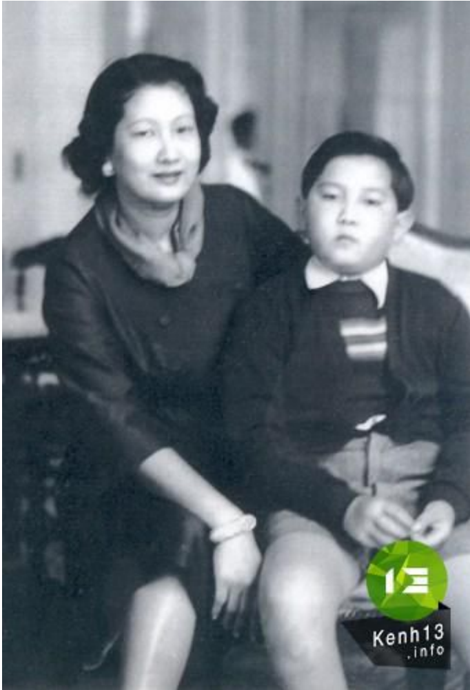
Hoàng hậu Nam Phương và Hoàng tử Bảo Thắng.