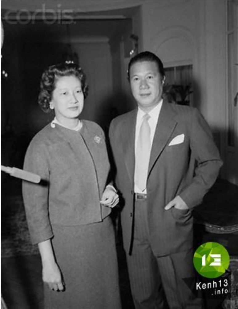
Nam Phương Hoàng hậu và cựu hoàng Bảo Đại ở Paris năm 1955.