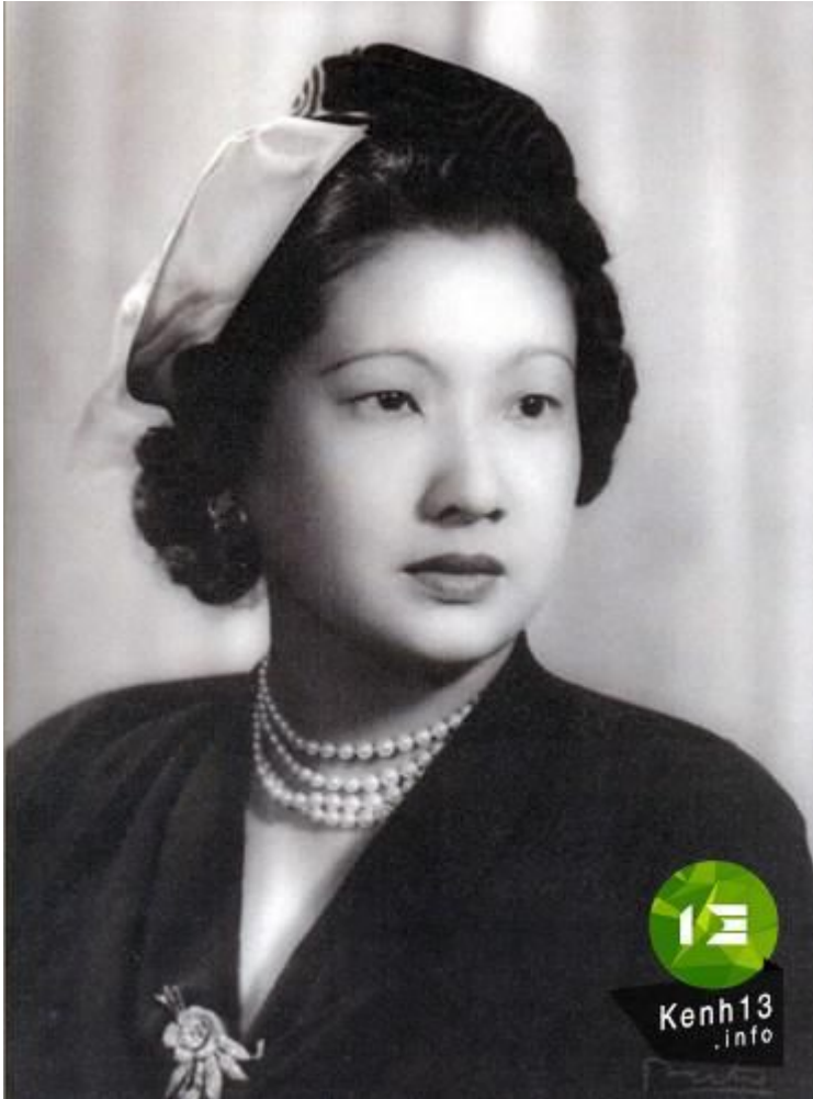
Nét quý phái của Hoàng hậu Nam Phương trong Âu phục, đầu thập niên 1950.