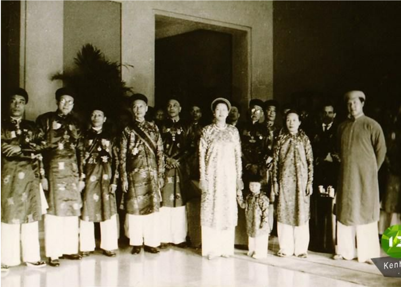
Hoàng hậu Nam Phương cùng vua Bảo Đại, Đức Từ cung, Hoàng tử Bảo Long và các quan lại triều Nguyễn.