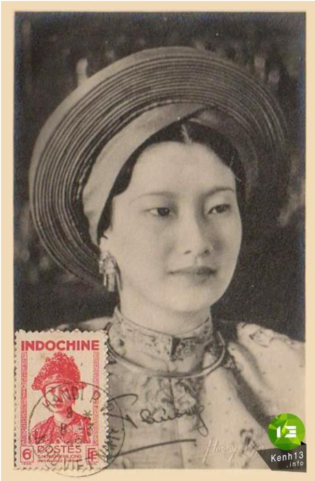
Chân dung Nam Phương Hoàng hậu trên một con tem.