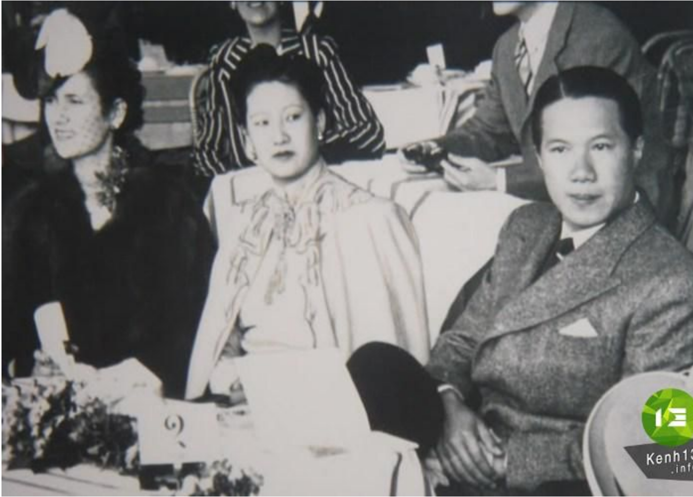
Nam Phương Hoàng Hậu và vua Bảo Đại tại Pháp năm 1938.