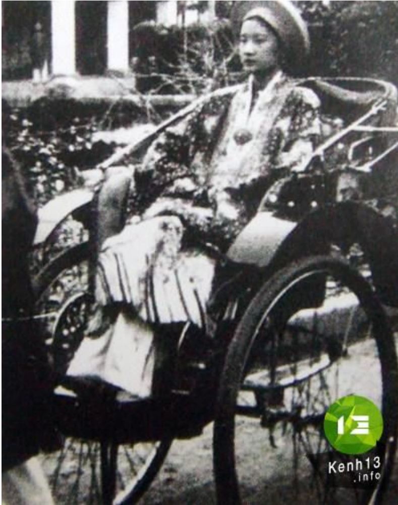
Hoàng hậu Nam Phương ngồi xe kéo trong Đại Nội, Huế.