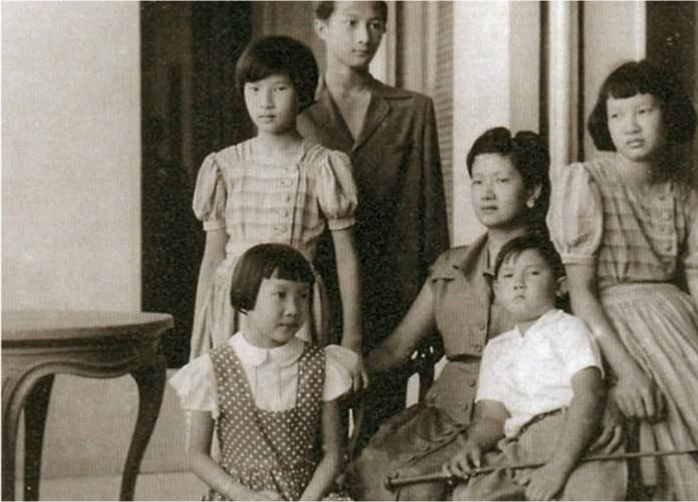
Nam Phương Hoàng hậu và 5 người con tại biệt thự Thorenc khoảng năm 1950.