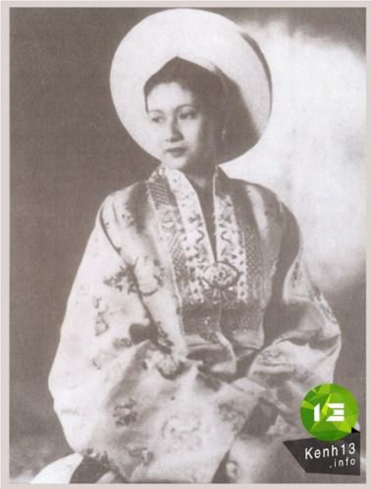
Nam Phương trong Lễ tấn phong Hoàng hậu, ngày 21/3/1934.