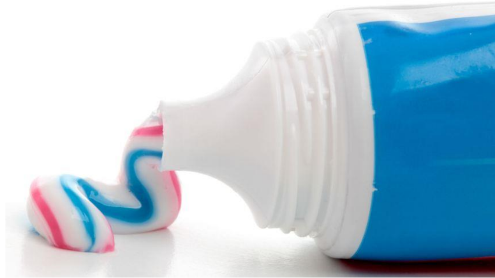
Kem đánh răng

Ít ai biết kem đánh răng có khả năng ngăn ngừa chảy máu, làm se da đồng thời giúp vết thương hoặc vết cắt nhỏ lành lại nhanh chóng Chỉ cần dùng một ít kem đánh răng đắp trực tiếp lên vết thương và để cho khô là được bạn nhé.