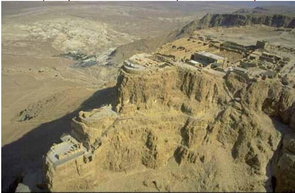
Massada- Pháo đài của người Do Thái nằm ở hướng tây Biển Chết

Biển Chết mang không khí khô, giàu oxy mà không có bất kỳ một sự ô nhiễm môi trường nào, nhiệt độ tương đối cao ngay cả mùa đông cũng không thuyên giảm. Thực tế là các tia cực tím có hại được lọc một cách tự nhiên. Vì vậy bạn vẫn có thể tắm nắng mà không lo sợ bị cháy nắng. Vùng nước chữa bệnh tự nhiên nằm dọc theo bờ biển kết hợp với lớp bùn đen ở bên dưới là liệu pháp điều trị sức khỏe và vẻ đẹp lý tưởng. Ngoài ra khu bảo tồn thiên nhiên và sự đa dạng của khu vực danh lam thắng cảnh mang lại một sự kết hợp độc đáo cho khung cảnh. Những ốc đảo sa mạc khô cằn bên cạnh những hồ bơi và thác nước đông đúc với hệ động thực vật. Các di tích lịch sử của khu vực là một trong những nơi nổi tiếng thế giới cụ thể như Massada, Jericho, Ein Gedi, các pháo đài La Mã và các pháo đài ở sa mạc Judea.